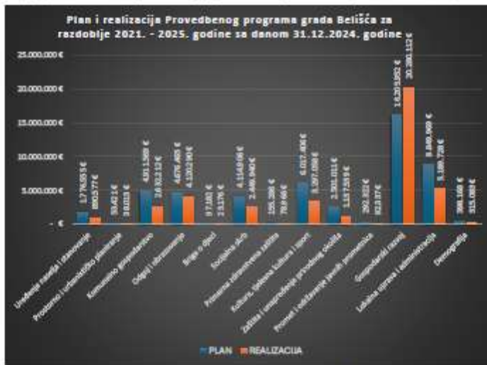
Izvor: Izvješće o izvršenju proračuna grada Belišća za razdoblje od 01.01.2024. do 31.12.2024. godine, Upravni odjel za financije i proračun, Belišća, siječanj 2025. godine

Iz sljedeće tablice možemo vidjeti da je postotak ostvarenja Provedbenog programa za mandatno razdoblje 2021.- 2025. godine s danom 31.12.2024. godine 81,11%.