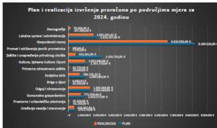
Grafički prikaz 2: Prikaz strukture planiranih i ostvarenih sredstava u proračunu po područjima mjera za u 2024. godini