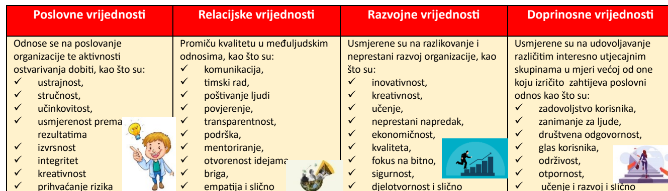
Tablica 1: Prikaz kategorija vrijednosti organizacije prema kriteriju primarne usmjerenosti u poslovanju

Izvor: I.Malbašić, R.Brčić: Organizacijske vrijednosti gospodarskih organizacija u Hrvatskoj, Ekonomski vjesnik, Osijek, 2011, str. 49-60.