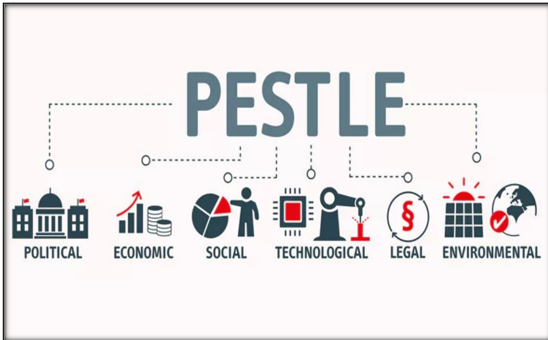
Slika 1: Grafički prikaz PESTEL analize

Naziv PESTLE zapravo je akronim od glavnih faktora koji se uzimaju u obzir kod ove analize. Glavni faktori PESTLE analize u početku su bili politički, ekonomski, sociološki i tehnološki. No, svjesni njihove važnosti, u analizu su dodani i pravni te okolišni čimbenici, te ih u nastavku prikazujemo slikovnim prikazom, i to kako sljedi: