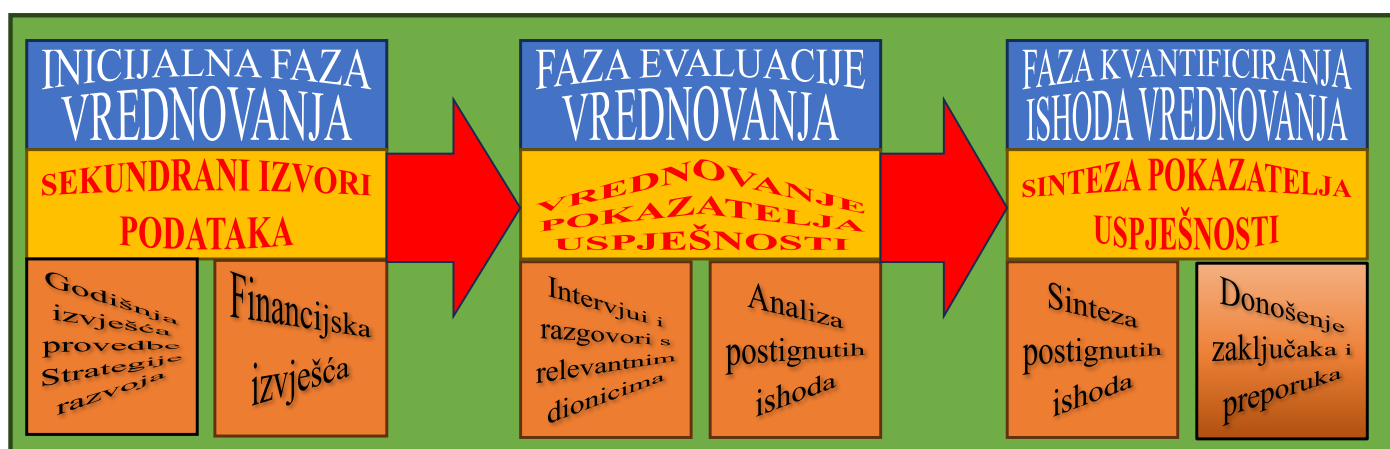
Grafikon 2: Prikaz procesa vrednovanja za vrijeme provedbe Strategije (Plana) razvoja grada Belišća za razdoblje 2021.-2027.godine

Cijeli proces vrednovanja za vrijeme provedbe S(P)RGB možemo prikazati sljedećim dijagramom i to kako sljedi: