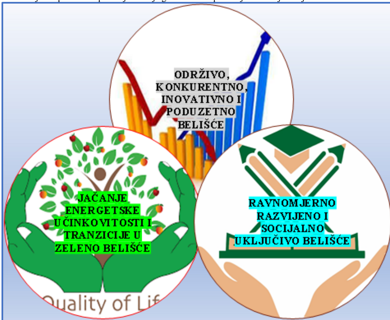
Slika 1: Prioritetna razvojna područja u izradi Strategije (plana) razvoja grada Belišća

Ključna prioritetna područja razvoja grada Belišća prikazujemo na sljedećoj slici: