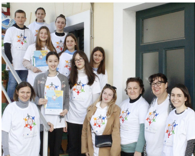
Lokalna inicijativa Djeca u akciji