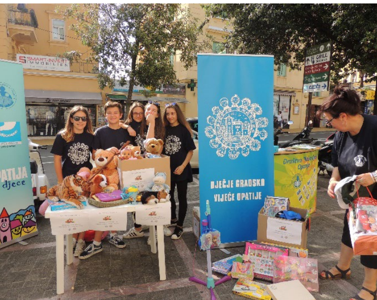
Dječji sajam razmjene, 2018.

Za provedbu ove volonterske akcije DND Opatija dobilo je Povelju za Naj akciju Središnjeg koordinacijskog odbora Saveza DND Hrvatske. Povelja je najviše priznanje koje se dodjeljuje za provedbu inovativnih akcija i aktivnosti kojima se promiču dječja prava i dječja participacija.