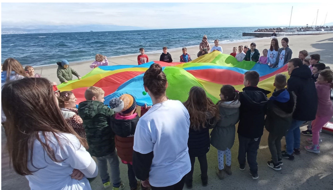
Lokalna inicijativa Djeca u akciji