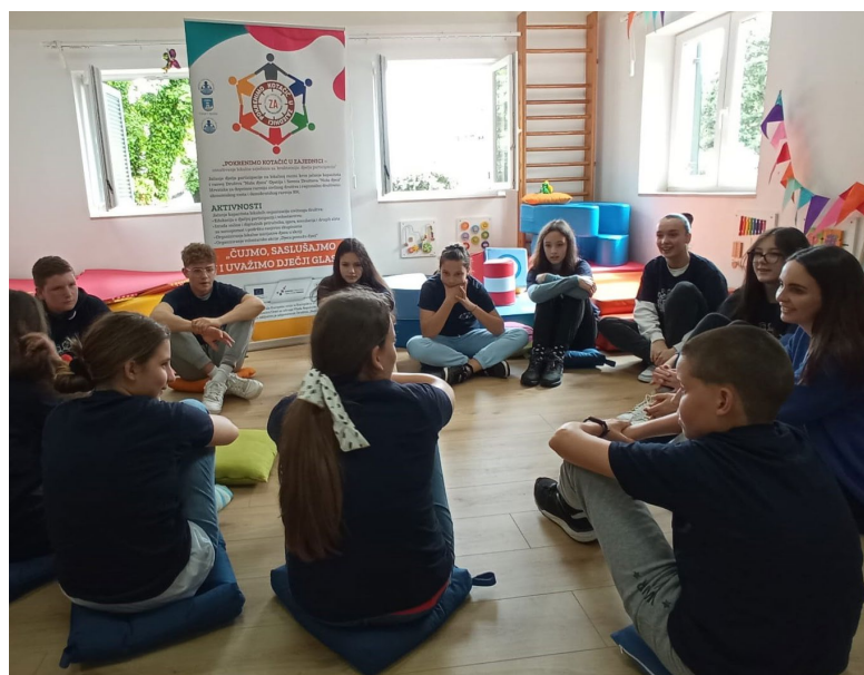
Volonterska akcija Djeca pomažu djeci - radionice

Na koji ćemo način provesti našu volontersku akciju ovisit će o kapacitetima i resursima kojima raspoložemo. Vrlo je važno provjeriti je li realizacija volonterske akcije u skladu sa zakonskom regulativom ( Zakon o volonterstvu , NN 58/07, 22/13,84/21), jesu li aktivnosti zamišljene unutar akcije primjerenе uzrastu djece i poštuju li aktivnosti načelo zaštite maloljetnih volontera iz Zakona o volonterstvu .