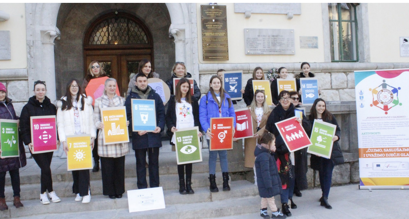
Lokalna inicijativa Djeca u akciji