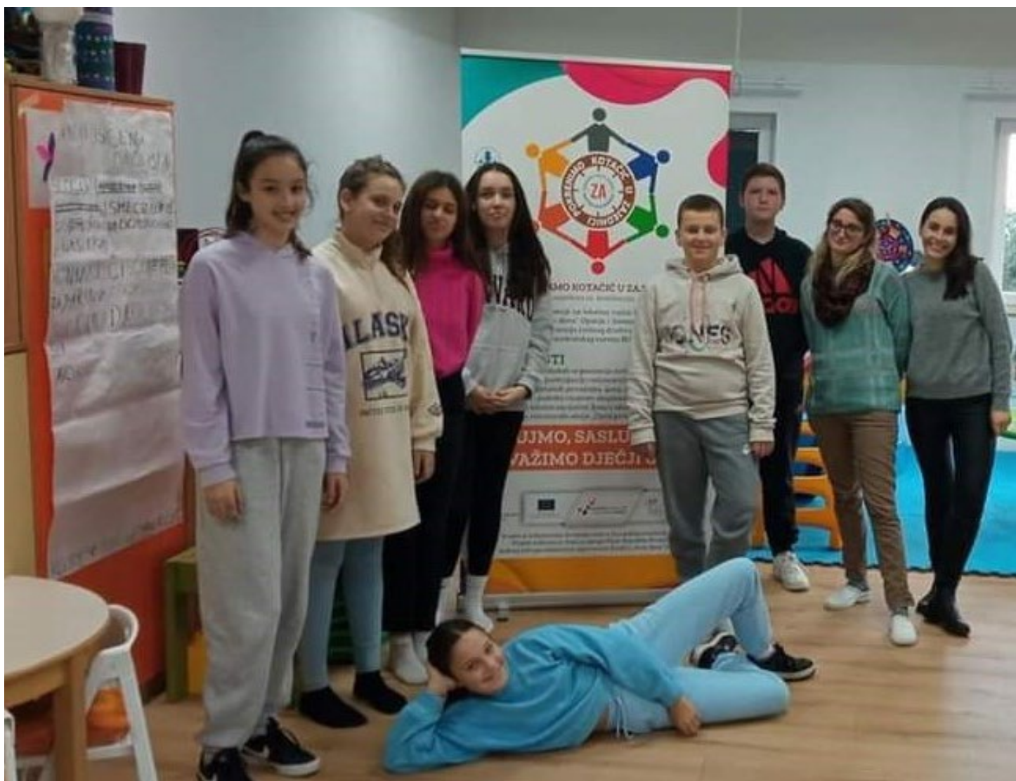
Volonterska akcija Djeca pomažu djeci - radionice