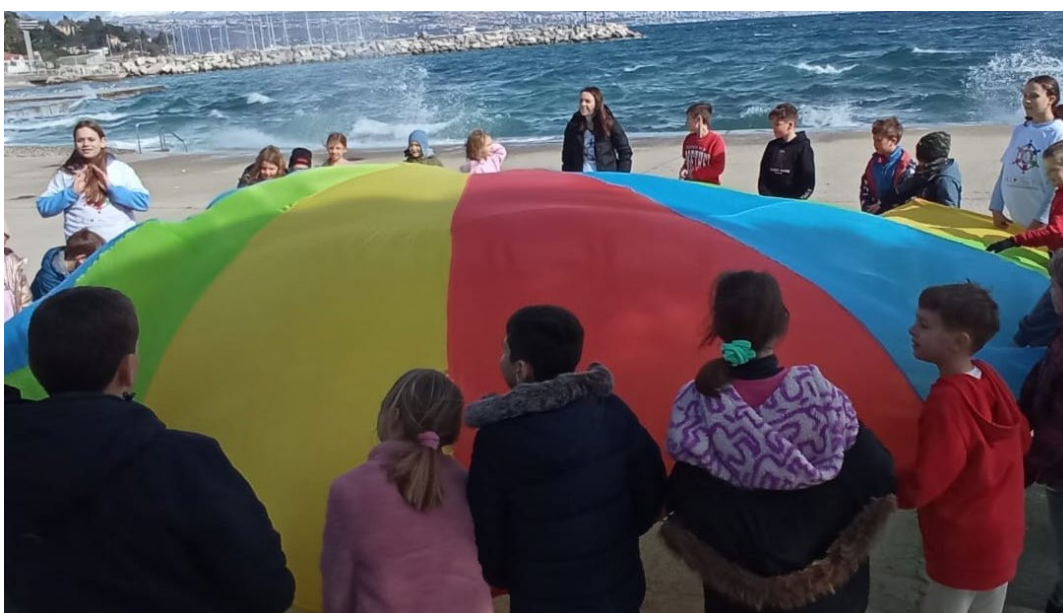
Lokalna inicijativa Djeca u akciji