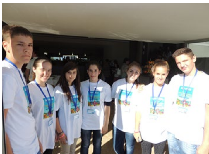
7. susret gradova prijatelja djece, volonteri DND Opatija i DGV Opatija, 2013.