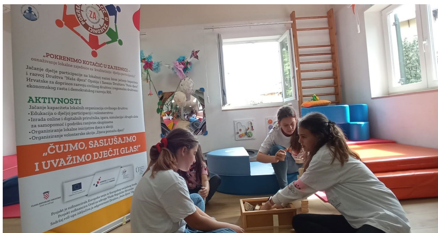
Volonterska akcija Djeca pomažu djeci - radionice