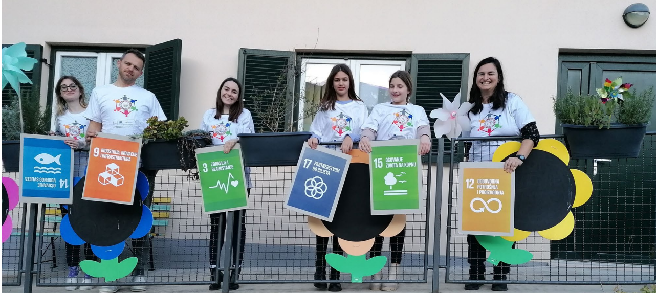
Lokalna inicijativa Djeca u akciji