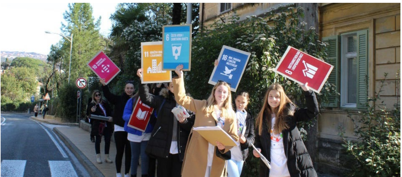
Lokalna inicijativa Djeca u akciji

Za više o EU fondovima: www.esf.hr i www.strukturnifondovi.hr