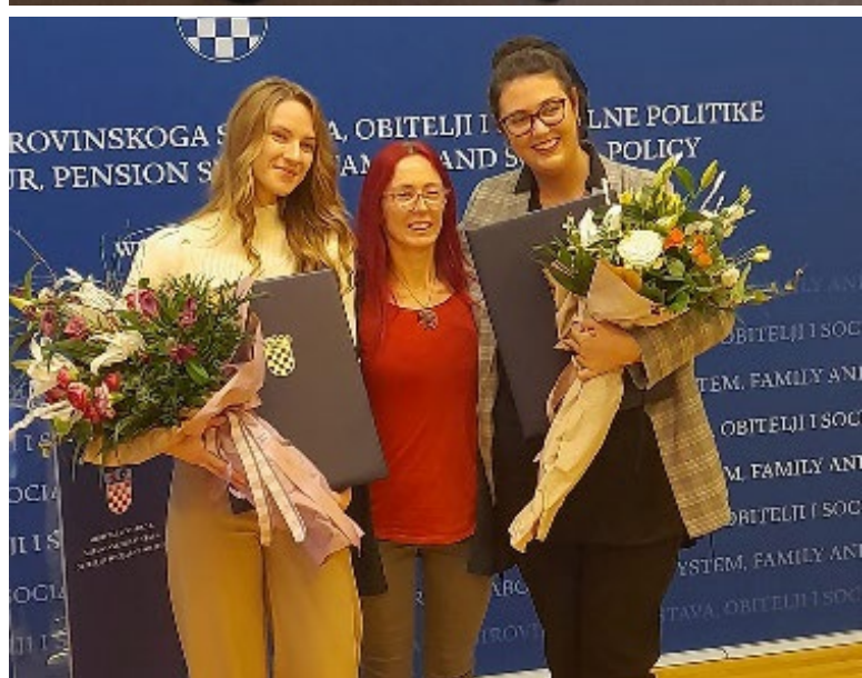
Nagrada "Organizator volontiranja 2022.;" Državne nagrade za volontiranje za fizičku osobu Koordinatora volontera 2022.