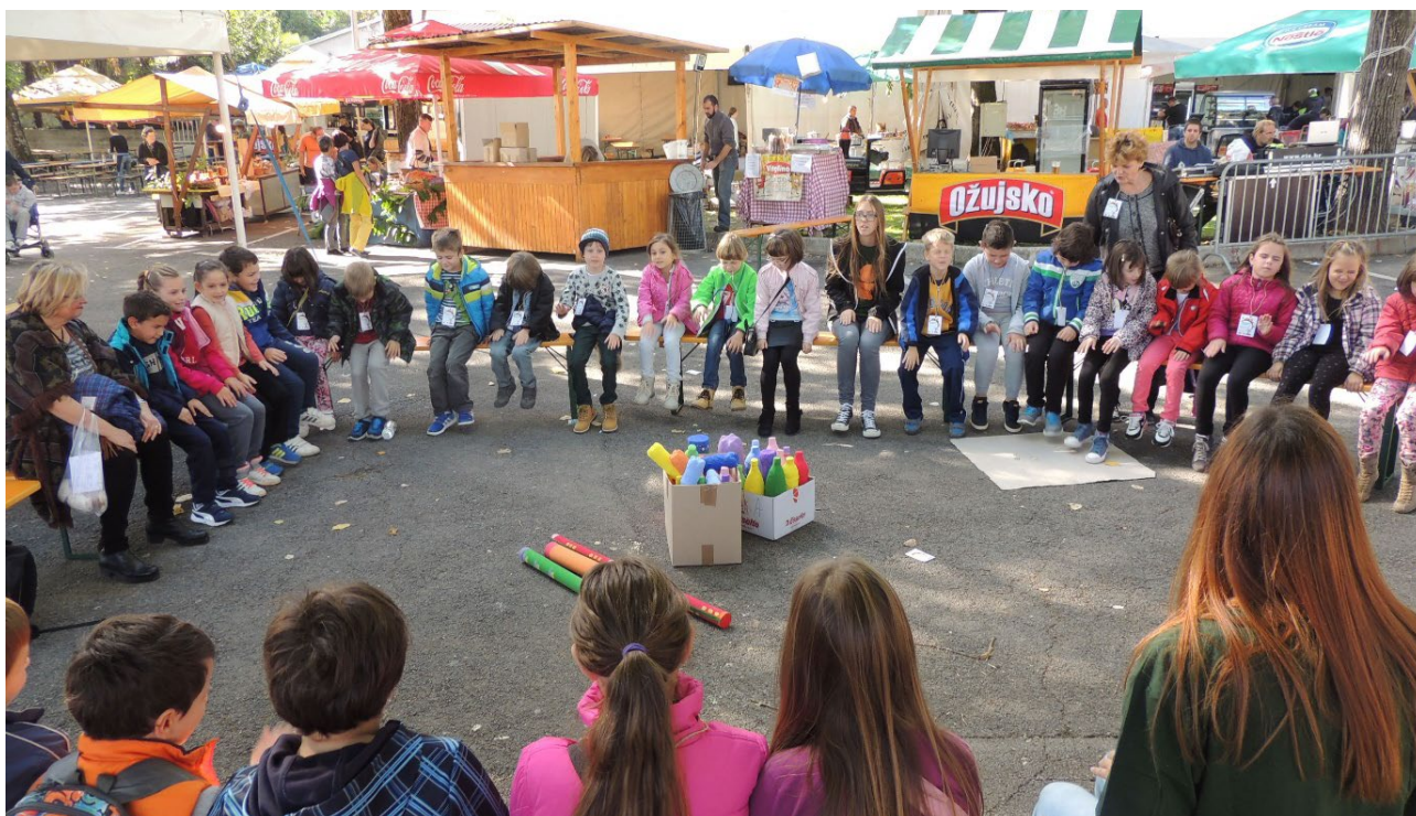
„Mića marunada va Lovrane“, 2015.

Program „Mića marunada va Lovrane“ odvija se na ulicama i trgovima Lovrana. „Mića marunada va Lovrane“ manifestacija je za djecu i s djecom koja se kontinuirano organizira već 14 godina za redom. Za ostvarivanje programa potreban je velik broj volontera. Tijekom ovih godina u našoj manifestaciji za koju smo nagrađeni Poveljom za Naj akciju Središnjeg koordinacijskog odbora Saveza DND Hrvatske, volontiralo je preko 110 volontera srednjoškolaca i studenata na što smo jako ponosni.