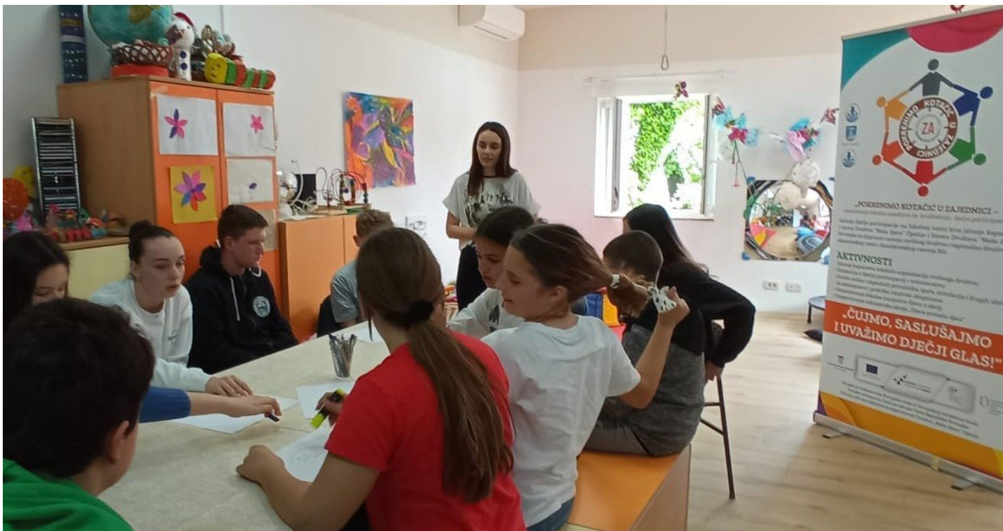
Volonterska akcija Djeca pomažu djeci - radionice

Prije nego li krenemo u osmišljavanje volonterske akcije s djecom moramo imati na umu sljedeće: