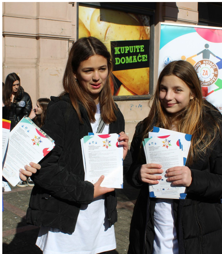
Lokalna inicijativa Djeca u akciji

Volontiranje se obavlja u skladu s međunarodnim i domaćim standardima za zaštitu okoliša i održivog razvoja zajednice i društva.