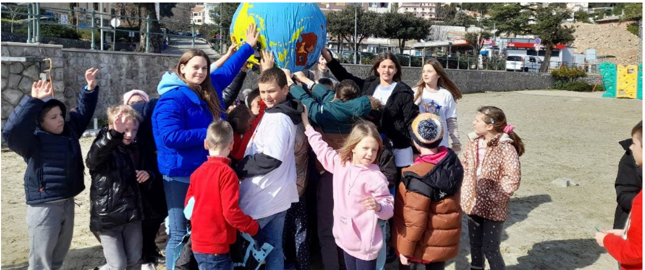
Lokalna inicijativa Djeca u akciji

Volonterkovi savjeti, Volonterska početnica za učenike osnovne škole, T. Tešija, 2015.