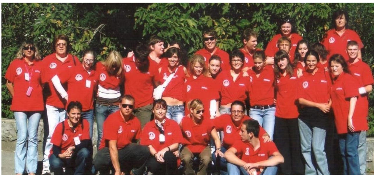
Smotra dječjeg stvaralaštva, Lovran, 2006., volonteri DND-a

tivne uloge djece u društvu u kojem žive, ali i njihovoj pripremi za budući život aktivnih građana koji će biti solidarni, aktivni; koji će znati prepoznati potrebe u svojoj zajednici i na njih odgovarati konkretnim akcijama i doprinositi boljem i pravednijem društvu.