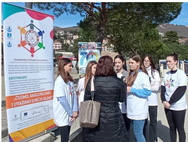
Lokalna inicijativa Djeca u akciji