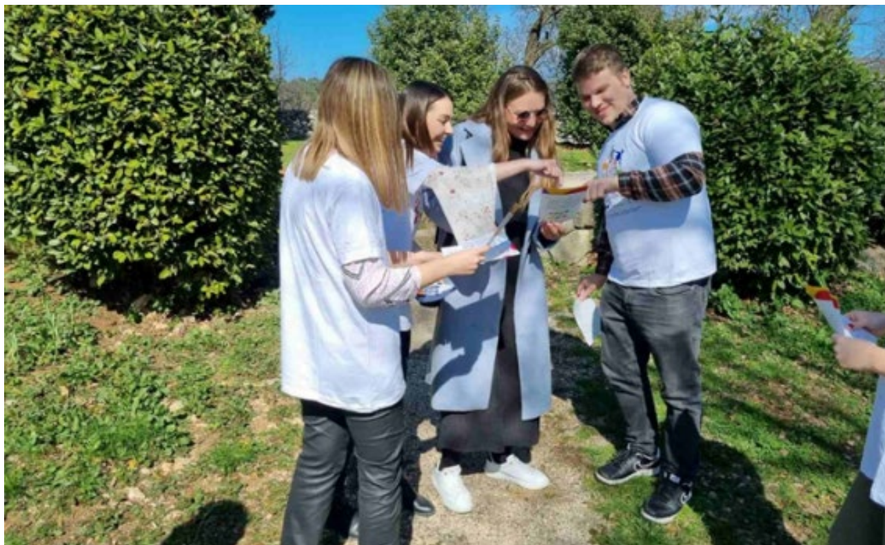
Lokalna inicijativa Djeca u akciji

Poticanjem inkluzije i različitosti utjecat će se na prihvaćanje i poštivanje različitosti te na razvoj vještina potrebnih za sudjelovanje u društvu. Stvaranje sigurnog i stimulativnog okruženja za učenje doprinosi individualnom i grupnom procesu učenja kroz igru, istraživanje i komunikaciju s vršnjacima.