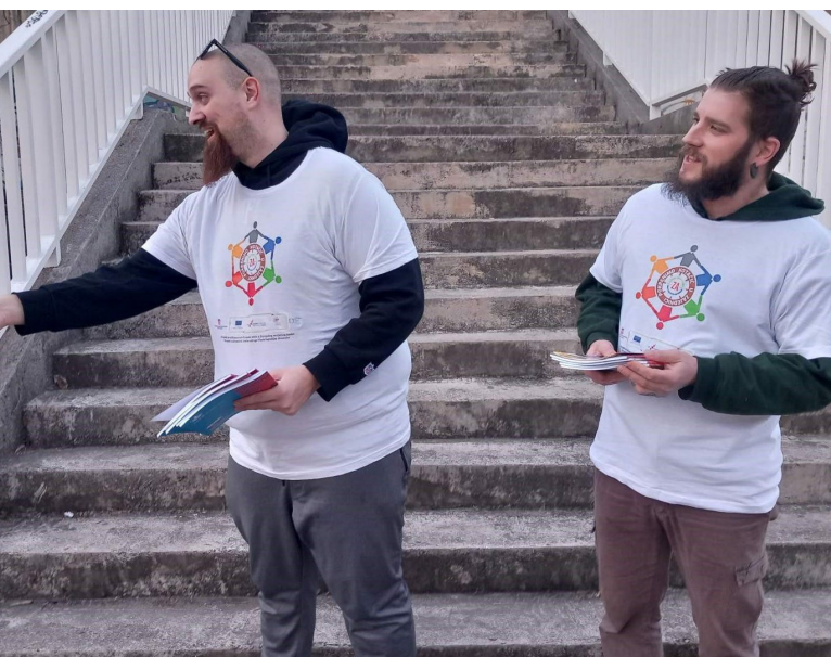
Lokalna inicijativa Djeca u akciji

Projekt je proveden u okviru Švicarsko-hrvatskog programa suradnje.