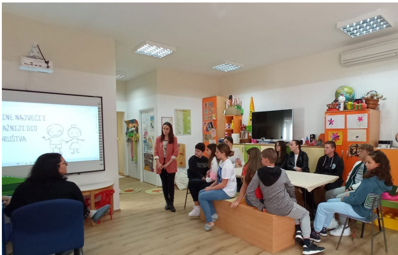
Volonterska akcija Djeca pomažu djeci– radionice, edukacija vršnjaka pomagača

Poželjno je da akcije u kojima sudjeluju djeca budu kratkotrajne i jednokratne kako bi se mogla uključiti i ona djeca koja imaju više obveza. Trajanje i opseg volonterskih akcija treba prilagođavati djeci volonterima kako bi bile izvedive.