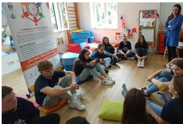
Volonterska akcija Djeca pomažu djeci, radionice, edukacija vršnjaka pomagača

Savez DND pokreće i potiče DND-ove na organiziranje lokalnih višegodišnjih kontinuiranih aktivnosti za djecu od kojih se ističu: Dječji tjedan, obilježavanje Međunarodnog dana obitelji, Dan igara, akciju Poruke djece odraslima, obilježavanje Dana Konvencije UN-a o pravima djeteta.