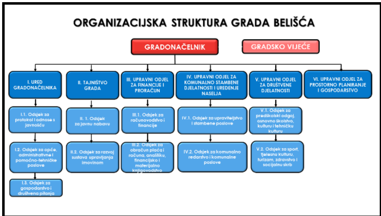
Grafički prikaz br. 1: Organizacijska struktura Grada Belišća